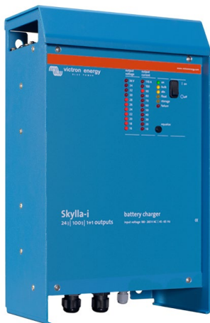
Skylla-i 24/100 (1+1)